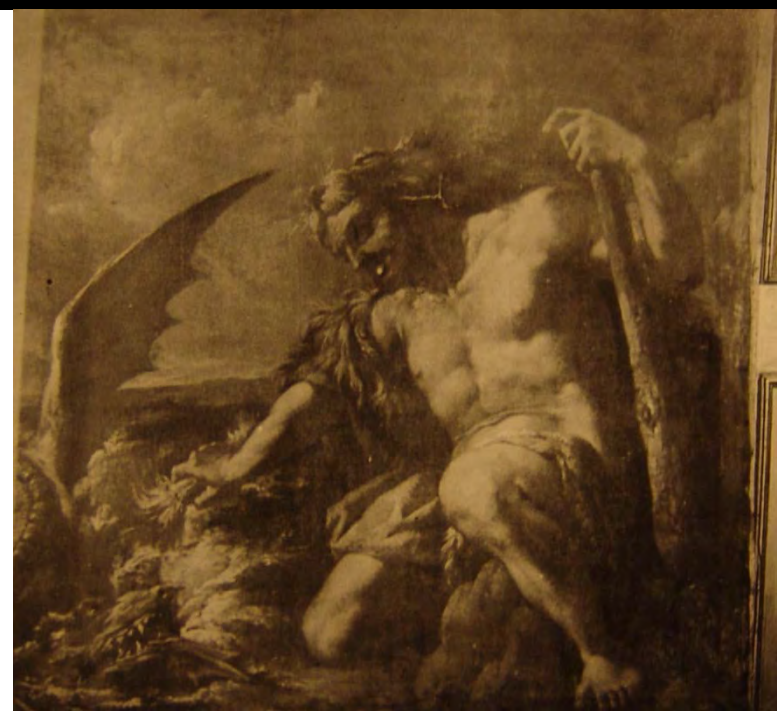
Izgubljena zbirka baročnih slik