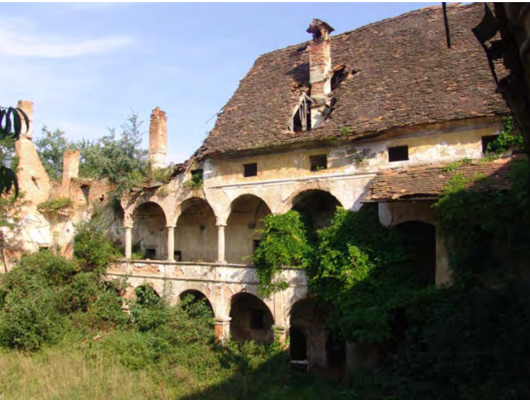
Dvorec Ravno polje pri Ptuj

DVOREC RAVNO POLJE PRI PTUJU: NEZADRŽNI PROPAD DVORCA Z ENIM NAJVEČJIH RENESANČNIH ARKADNIH DVORIŠČ V SLOVENIJI V ZADNJIH DESETLETJIH