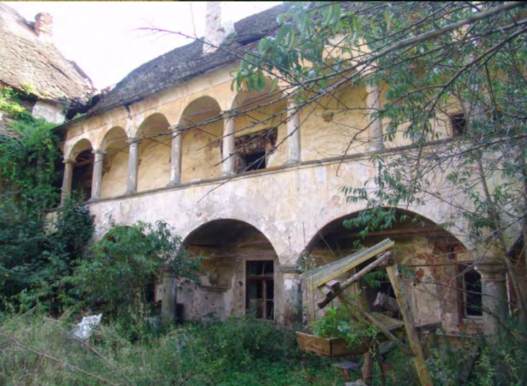
2005 (levo) in 2010 (desno)